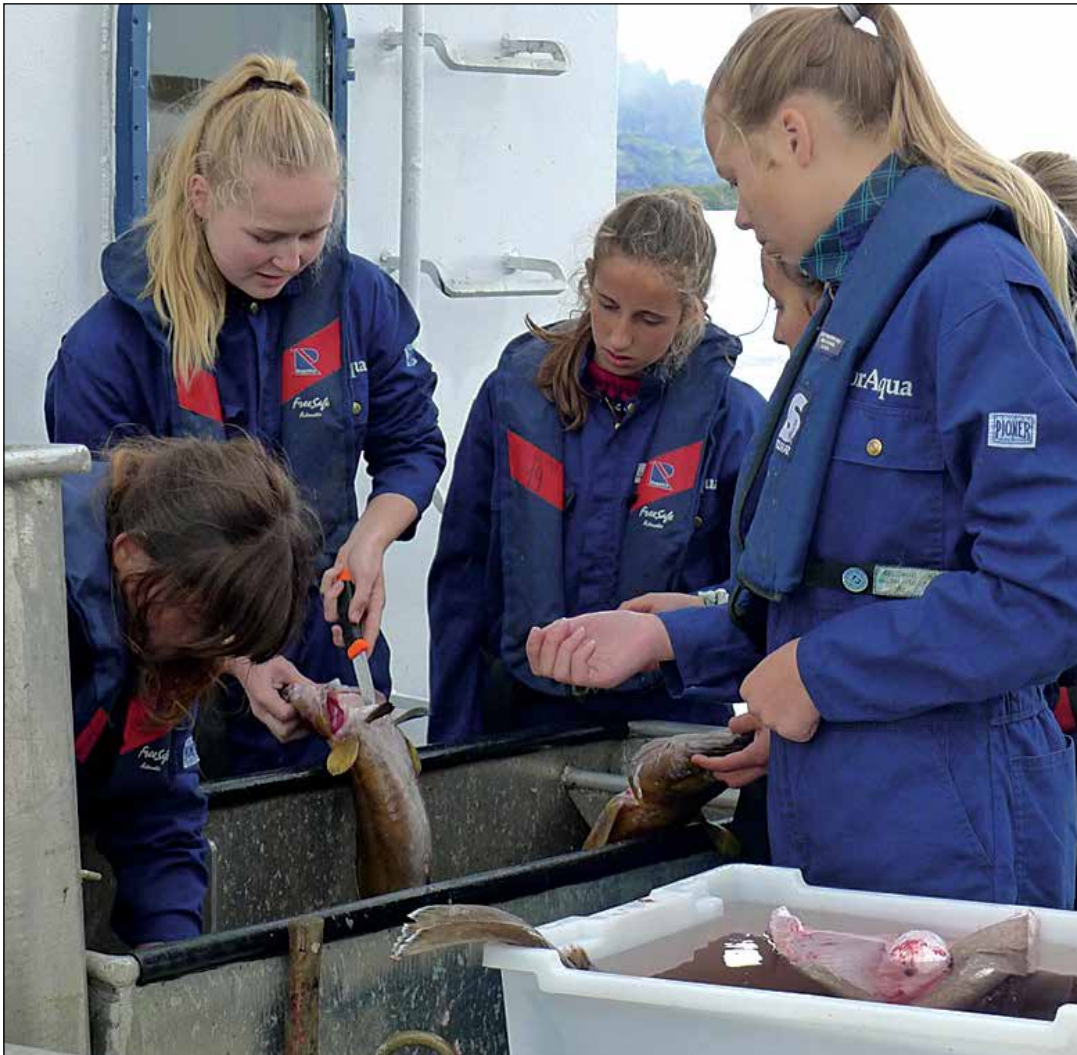
JENTELEIR 2013: Ivrige jenter tar imot fangsten på Salthammer tidligere i år. Nå er det guttas tur for første gang.

GILDESKÅL: Nå er det klart for fiskeri- og havbruksleir også for gutter. Etter 17 år med vellykka jenteleirer arrangerer Kunnskapsenteret i Gildeskål (KiG) i høst den aller første gutteleiren på Inndyr.