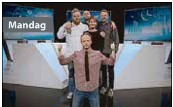
Mandag 22.00 Brille Brille er et humorbasert panelshow hvor landets ledende komikere får bryne seg på tilsynelatende umulige spørsmål