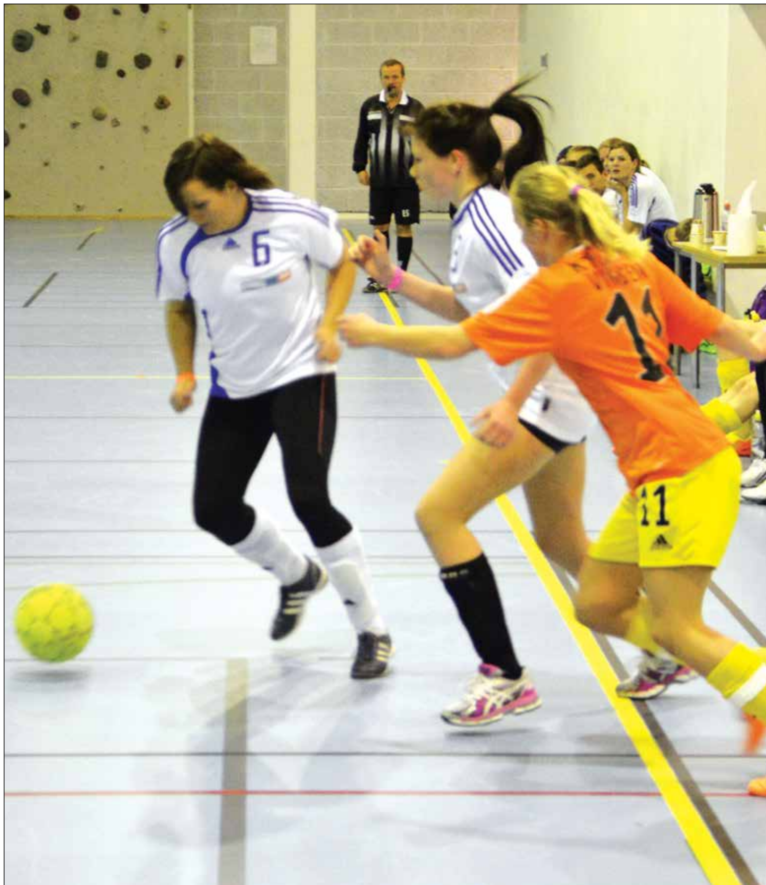
INNSATSEN var det ingen ting å si på. Her er det spillere fra Hønsriet og Titanium som er i kamp om kula.