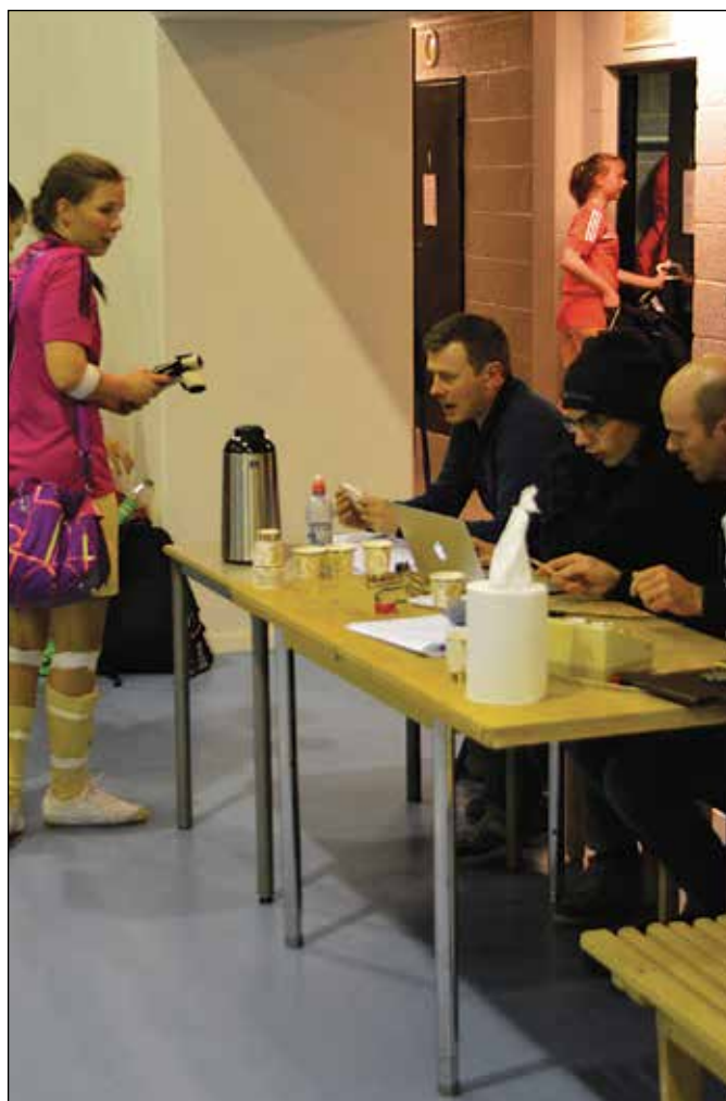
SEKRETARIATET sørget for å holde oversikt over 60 kamper og registrerte 323 mål.