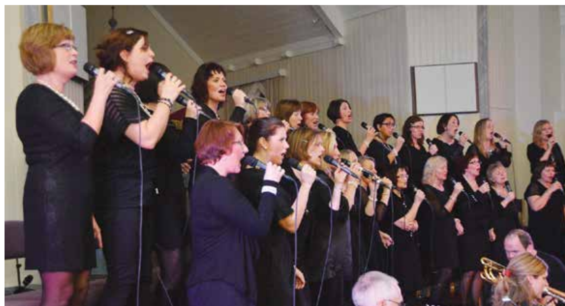
DYKTIGE: MeSDameS sto for en stor prestasjon i Fore kirke.

Et besøkstall under to hundre er ikke imponerende, men det var til gjengjeld prestasjonene, i alle ledd.