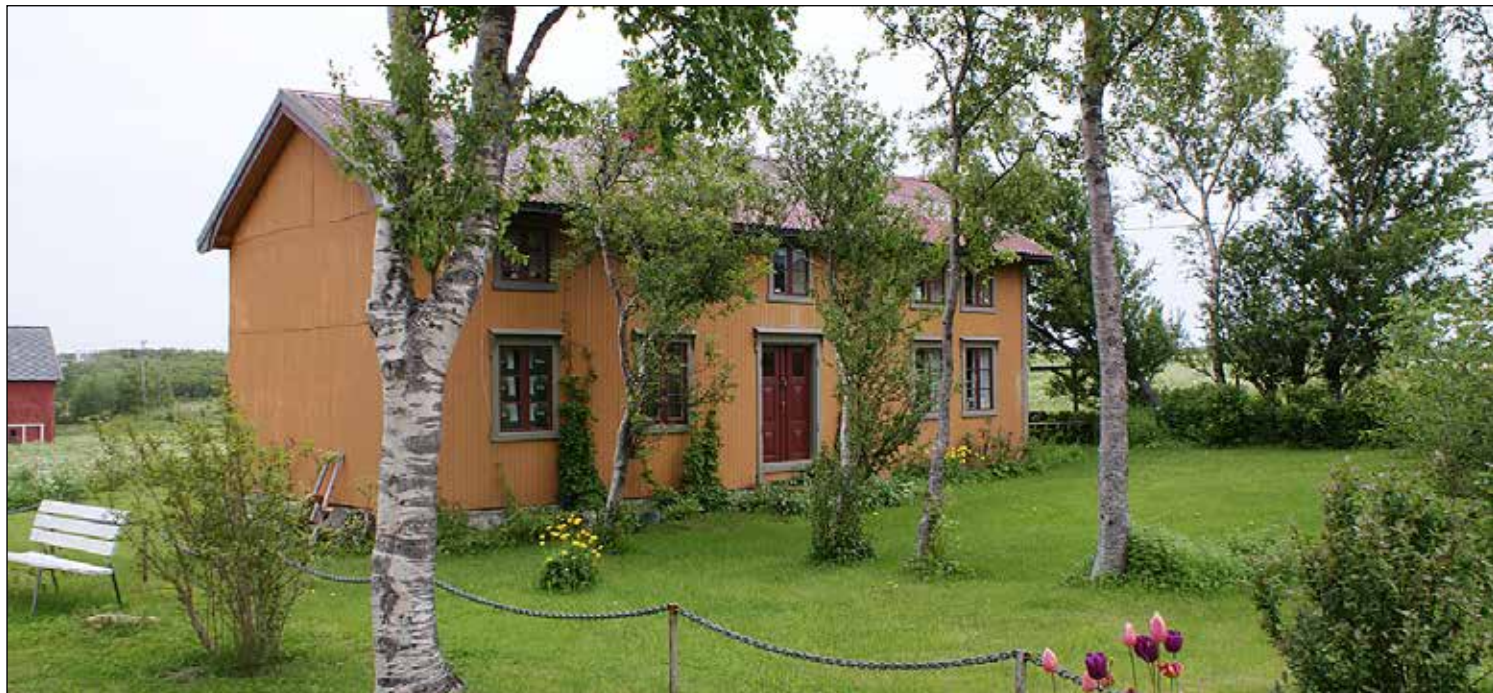
SATSER PÅ BLIX: Ved å kjøpe huset ved siden av bautaen av Elisa Blix har Gildeskål sikret seg muligheten til å markere tilhørigheten til Gildeskål bedre.

- Huset har, etter hva vi har funnet ut, historie bak til 1875. Bygningen er i ettertid blitt reparert og det er kommet til et lite tilbygg, men ellers er det i grove trekk identisk med hvordan det var da det ble satt opp, fortsetter ordføreren. Han legger til at husets beliggenhet helt inn til der bysten av Blix i