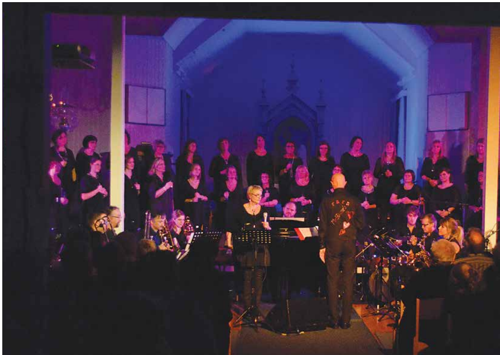
FORE KIRKE var vert for konserten med blant andre MeSDameS og Bodø Big Band.

Litt synd at ikke flere fant veien til Fore kirke på lørdag. Konserten hadde fortjent det.