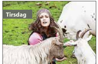
Tirsdag 21.30 Jakten på det perfekte livet Svensk dokumentarserie fra SVT i åtte deler