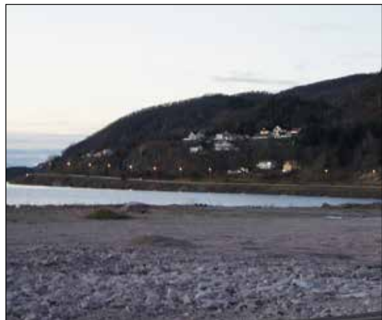
Den omdiskuterte fyllinga på Ørnes