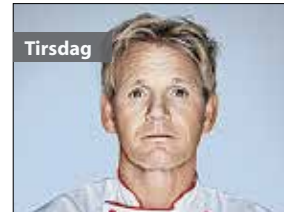
Tirsdag 22.30 Gordon Ramsay Gordon Ramsays hotelleksperiment