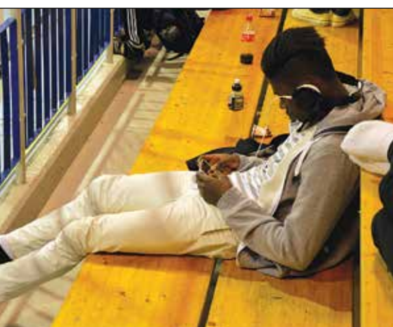
APPING er viktig, enten en er spiller eller publikummer.