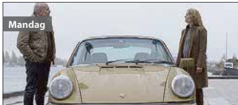
Mandag 21.30 Broen Politiet har nok informasjon til å lage et fantombilde av den ettersøkte, og Saga og Martin tror saken snart er oppklart. Men det tar lengere tid enn de tror

06.00 Til Death 07.00 TV Shop 07.30 Ellen DeGeneres Show 08.20 Hellstrøm inviterer 08.20 Fabian Stang 08.45 Stella Mwangi 09.15 MasterChef Norge 10.10 Dr. Phil 12.00 Ellen DeGeneres Show 13.00 Ekstreme samlere 14.00 Supersize VS. Super-skinny 15.00 Hell's Kitchen USA 16.00 Kongen av Queens 16.30 NCIS 17.30 Bones 18.30 MasterChef Norge 19.30 MasterChef Norge 20.30 Luksusfellen Sverige 21.30 Boligjakten 22.30 Top Model Norge 23.30 Sex og singelliv 00.15 Sex og singelliv 00.55 Kongen av Queens 01.25 Bones 02.25 NCIS 03.15 Hell's Kitchen USA 04.00 Sex og singelliv 04.30 Sex og singelliv 05.05 Ekstreme samlere