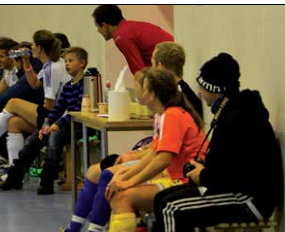
BYTTERE: På innbyttebenkene var det til tider hektisk et.