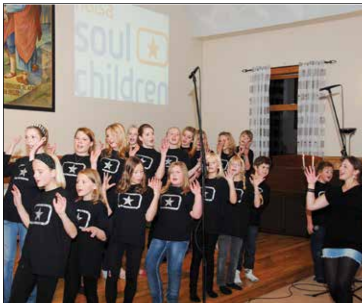
SOUL CHILDREN: Halsa Soulchildren skal sammen med Ørnes soulchildren og Halsa barnekor være med på konserten i Halsa Frikirke.

låtskriver i genren akustisk pop. Hun er også innom flere ulike musikkstiler som lett country, visesang med mere. (Kilde: Wikipedia)