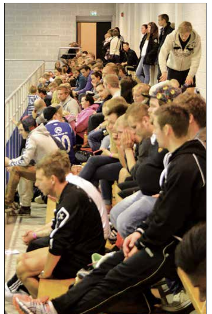
TRIBUNENE var stort sett full under hele turneringen. Rundt 300 fant veien til Glomfjordhallen sist helg.