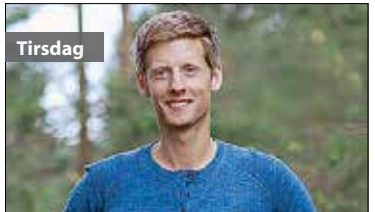
Tirsdag 21.45 Farmen Det er førstekjempevalg i kveldens episode. Storbonden rådfører seg med hjelperne og legger en plan for å sikre seg